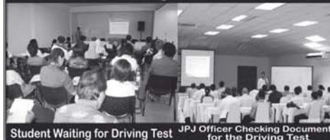
Student Waiting for Driving Test