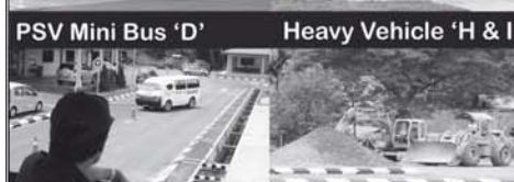
PSV Mini Bus 'D'